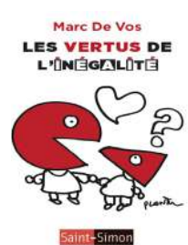
Les Vertus de l'inégalité Marc De Vos